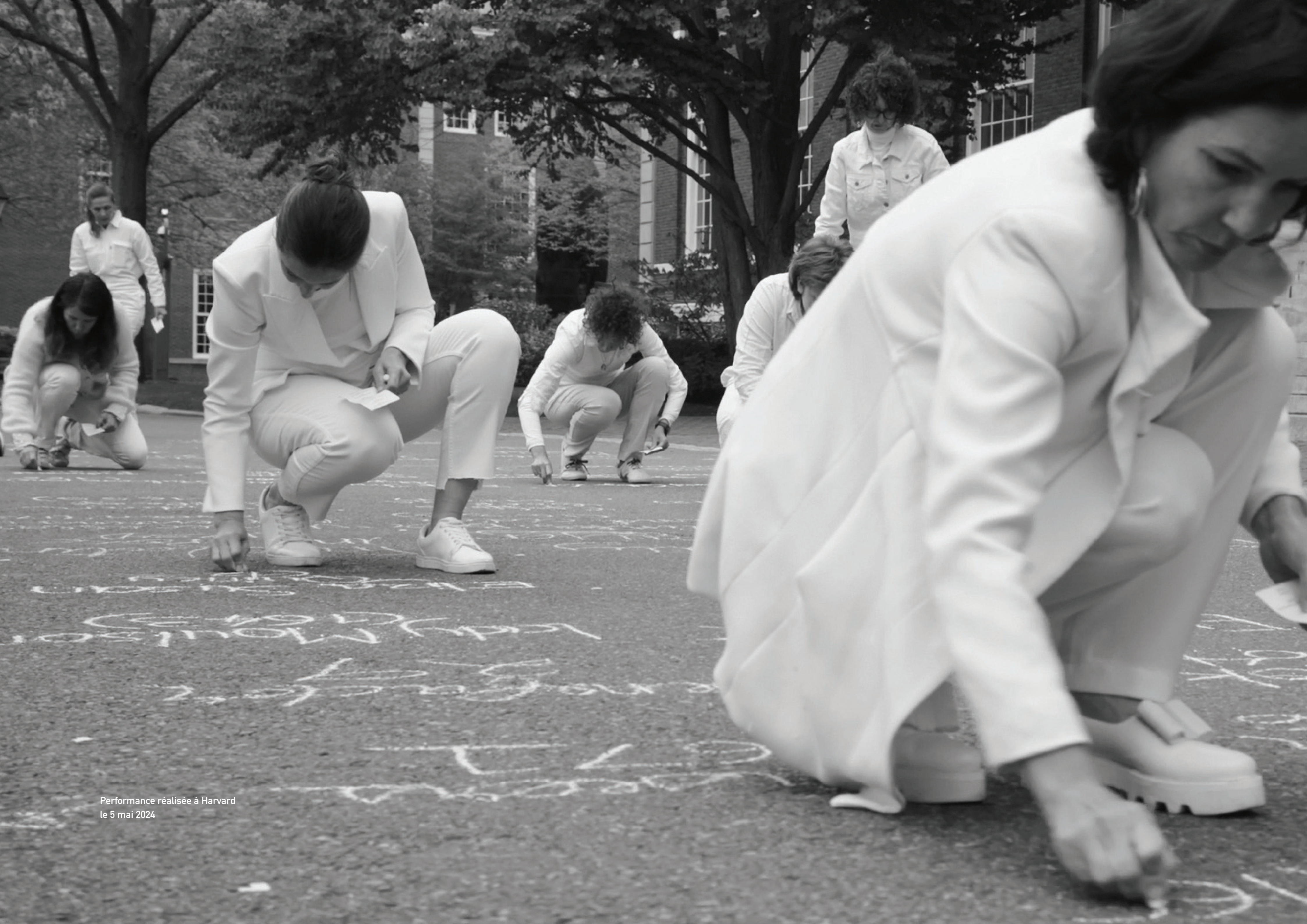
Performance réalisée à Harvard le 5 mai 2024